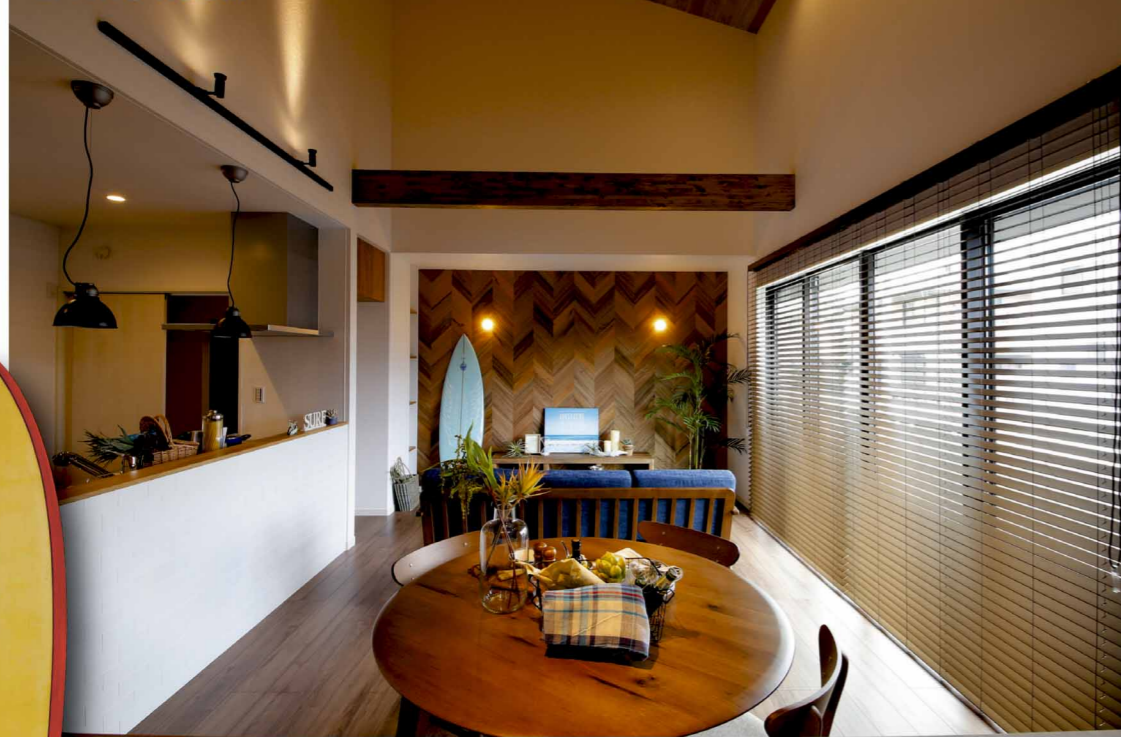
高さのあるこぎ配天井で、リビングはとっても開放的。趣味のサーフボードがインテリアのアクセントに。